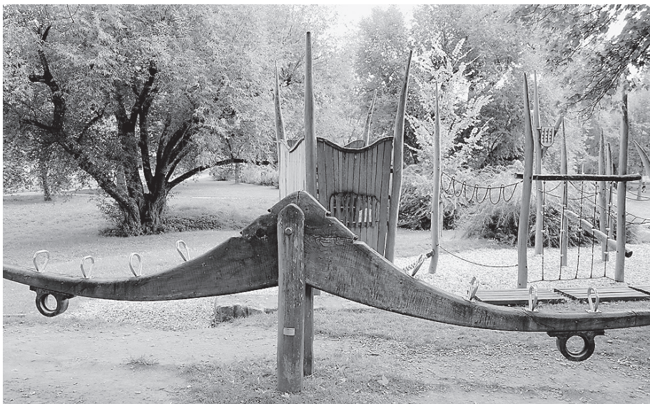
Der Spielplatz an der Jagstau soll etwas umgestaltet und somit auch für größere Kinder attraktiver werden.

soll künftig in einigen Bereichen umgestaltet werden, um auch größeren Kindern mehr Spielmöglichkeiten zu bieten.