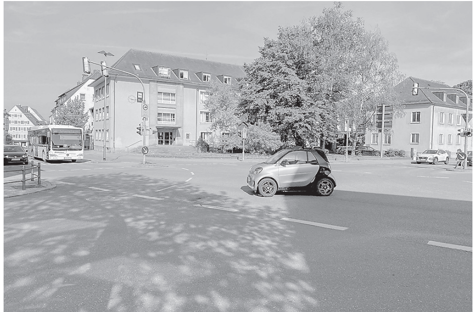
Die Kreuzung wird umfassend saniert.

Die Durchführung dieser umfangreichen Bauarbeiten stellt zweifellos eine vorübergehende Beeinträchtigung für