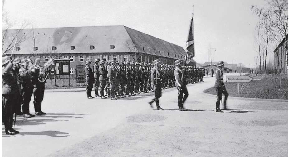
Blick in die Geschichte: Ein Appell vor dem Kasernengebäude in der Hardtstraße.

Mit dem Bau des Fliegerhorstes in den Jahren 1935/36 wurde Crailsheim nach mehr als 120 Jahren wieder Militärstandort. Im Westen der Stadt entstand ein großes Militärareal mit Torbogengebäude, Mannschaftsunterkünften, Flugzeughallen und Flugfeld, das in der Endphase des Zweiten Weltkriegs mehrfach beschossen und bombardiert wurde. Nach dem Krieg wurden die Fliegerhorstgebäude zur Unterbringung von Flüchtlingen und Ausgebombten sowie als erste Standorte für Firmen, Behörden und Schulen (Fliegerhorstschule) genutzt. Auf einem Teil des ehemaligen Fliegerhorstgeländes entstanden die McKee Barracks, in denen von 1952 bis 1993 verschiedene Einheiten der US-Streitkräfte stationiert waren.