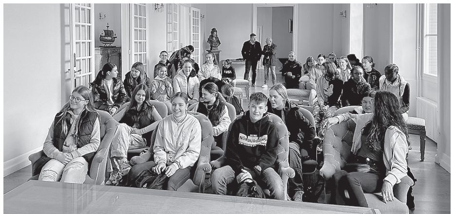
Nach drei Jahren Pause fand nun wieder ein Schüleraustausch des ASG mit Pamiers statt.

Ganz im Sinne der Nachhaltigkeit reisten die Schülerinnen und Schüler mit der Bahn an. Am frühen Morgen erreichten die Austauschschülerinnen und -schüler dann den Bahnhof von Pamiers. Wie sehr sich das Schulleben in Frankreich an einem Collège beispielsweise vom Schulleben an einer deutschen Schule unterscheidet, erlebten die Schülerinnen und Schüler vom ersten Tag an: Wer sich verspätet, steht am Collège vor verschlossener Tür. Dank des abwechslungsreichen Pro-