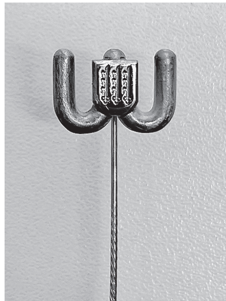
Die nächste Verleihung des Goldenen Horaffs ist für Februar 2024 geplant.