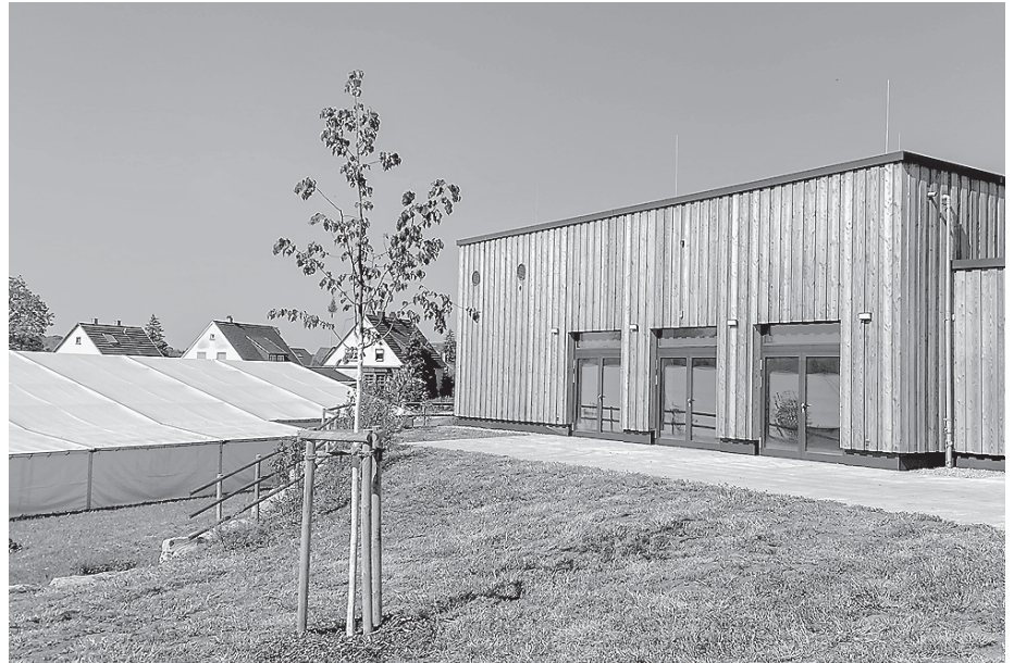
Das Festzelt steht bereits direkt am neuen Bürgerhaus, das am Festwochenende eingeweiht wird.

Am Samstag steht die offizielle Einweihung des Bürgerhauses im Mittelpunkt, bei der auch Oberbürgermeister Dr. Christoph Grimmer dabei sein wird. Um 13.00 Uhr wird das Gebäude feierlich eröffnet und im Anschluss daran werden die Gäste im Bürgerhaus empfangen. Um 15.00 Uhr findet die Prämierung der Sieger des Fotowettbewerbes statt, gefolgt von der Eröffnung einer Fotoausstellung im Foyer des Bürgerhauses. Die Ausstellung kann am Samstag von 15.00 bis 17.00 Uhr und am Sonntag von 12.00 bis 17.00 Uhr besich-