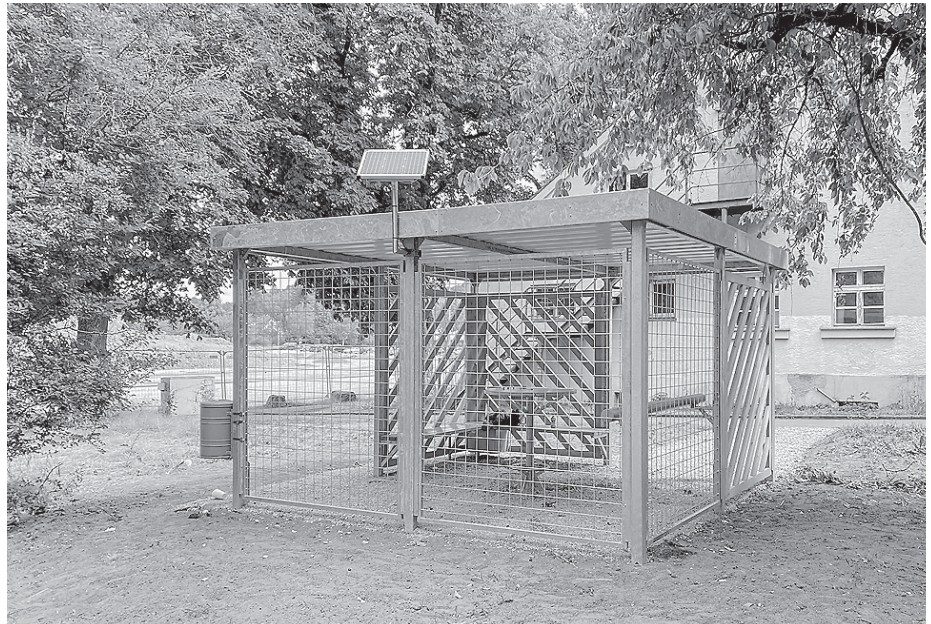
Jetzt läuft die Testphase für den neuen Jugendunterstand, der derzeit zwischen Jugendbüro und Jugendzentrum steht.