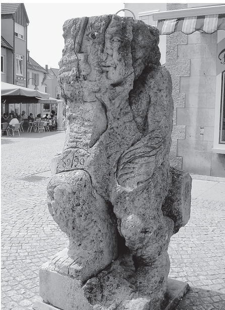
Am Sonntag, 9. Juli, findet erneut eine Führung zu Kunstwerken im öffentlichen Raum statt.

Info: Die Führung findet am Sonntag, 9. Juli, um 14.30 Uhr statt. Treffpunkt ist der Brunnen auf dem Marktplatz. Eine Voranmeldung ist nicht erforderlich. Die Führung dauert etwa 90 Minuten.