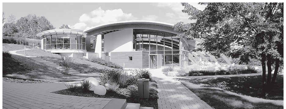
Die Revisionszeit ist bald beendet und die Crailsheimer Saunalandschaft parc vital ist ab Samstag, 8. Juli, 10.00 Uhr wieder für die Gäste geöffnet.

Außerdem stehen künftig zwei neue Infrarotsitze, nicht nur für Gäste mit