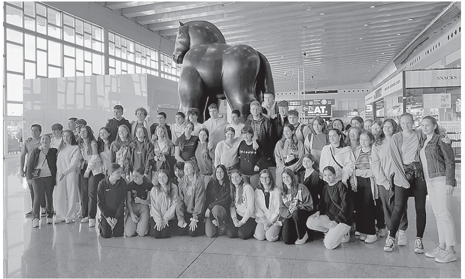
Die Freude über den Schüleraustausch mit der Deutschen Schule Barcelona war groß, nachdem die letzten Jahre coronabedingt keine Besuche möglich waren.

Am zweiten Tag ging es nach Castelldefels an den Strand, um dort in gemischten Teams Beachsoccer, Beachvolleyball und Brennball zu spielen. Einige Mutige nutzten die Gelegenheit, um sich im noch sehr kühlen Mittelmeer zu erfrischen. Am Mittwoch stand für die ASGler der Stadtrundgang in der katalanischen Metropole auf dem Programm. Zu Fuß wurde unter anderem der Montjuic erklommen. Die Aus-