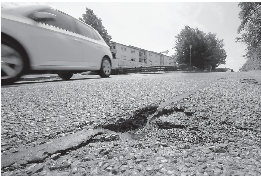
Teils tiefe Schlaglöcher zieren derzeit die Brunnenstraße. Diese sollen nun bei umfangreichen Sanierungsarbeiten verschwinden.

Der geplante Vollausbau umfasst die Sanierung der Asphaltschichten und des Unterbaus. Zusätzlich werden die Bushaltestellen im Bau Feld barrierefrei umgebaut und die Straßenbeleuchtung erneuert. Die Stadtwerke werden bestimmte Abschnitte der vorhandenen Gasleitung austauschen. Im gesamten Bereich werden Niederspannungsleitungen und Breitbanderohre verlegt. Die Sauerbrunnen- und Brunnenstraße fungieren als Anlieger- und Sammelstraße. Im Zuge der Sanierung wird die Straßenbreite von derzeit 5,90 Meter auf 5,50 Meter reduziert, um den Gehweg zu erweitern und die Fußgängerfreundlichkeit zu verbessern. Die Maßnahmen haben einen Kostenumfang von 1,106 Mio. Euro und sollen bis Jahresende abgeschlossen sein.