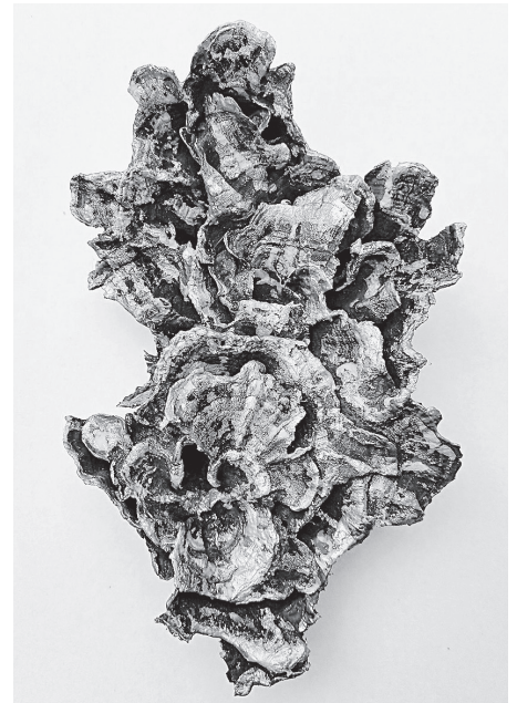
Der ukrainische Künstler Vitaly Ging stellt im Stadtmuseum und der vhs aus.

Info: Die Ausstellung ist zu den jeweiligen Öffnungszeiten zu sehen. Im Stadtmuseum mittwochs von 9.00 bis 19.00 Uhr, samstags von 14.00 bis 18.00 Uhr und an Sonn- und Feiertagen von 11.00 bis 18.00 Uhr. Die vhs hat von Montag bis Freitag von 8.00 bis 19.00 Uhr geöffnet, im August gegebenenfalls eingeschränkte Öffnungszeiten.