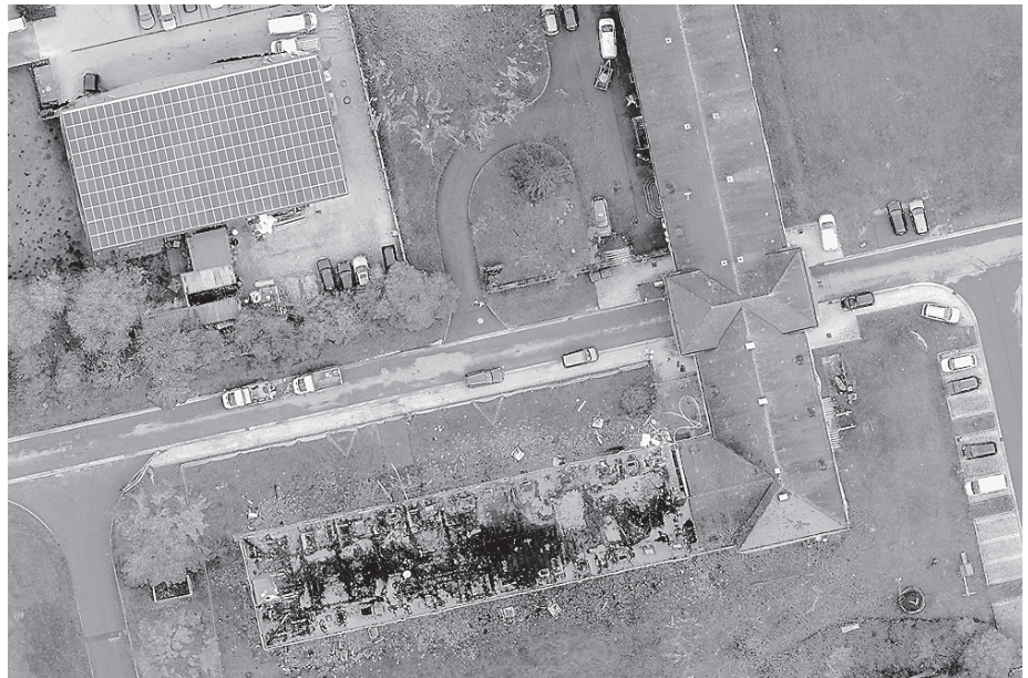
Das Feuer im Mai 2021 zerstörte einen ganzen Dachstuhl.

Die Stadt entschied sich, die Gebäude zu renovieren und sie als Wohnungen zur Verfügung zu stellen. Die ersten Sanierungsarbeiten wurden Mitte der 1990er gestartet, ab dem Jahr 2000 wurde die komplette Kasernenanlage im nordwestlichen Bereich der Burgbergstraße abgerissen. Dort entstanden zum einen das Wohn- und Mischgebiet Hirtenwiesen, zum anderen das Gewerbegebiet Hardt. In diesem Zuge wurden auch im Bereich der Burgbergstraße zahlreiche Wohnungen renoviert und modernisiert. Einige dieser Wohnungen wurden als Sozialwohnungen und Obdachlosenunterkünfte eingerichtet. Die Stadt Crailsheim hatte damit begonnen, eine angemessene Wohnsituation für die Bedürfnisse der Bürgerinnen und Bürger zu schaffen, auch Einkaufsmöglichkeiten siedelten sich dort an.