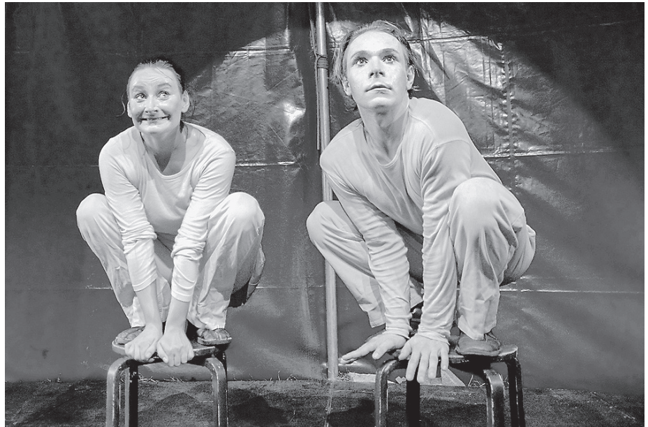
Schreiber & Post benötigen nur zwei Hocker und Fantasie, um zu unterhalten.

Auf dem Marktplatz ist wieder feinstes Straßentheater geboten. Die Berliner Compagnie Theatre Fragile hat ihren