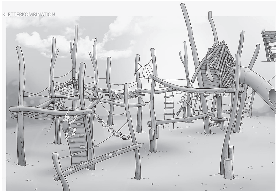
So könnte die Kletterkombination auf dem Spielplatz Hans-Neu-Weg/Sandgrubenstraße künftig aussehen. Skizze: Krambamboul

Bei der Umfrage haben sich darüber hinaus weitere Wünsche der Anwohnerinnen und Anwohner ergeben, denen die Stadtverwaltung gerne nachkommt. Es wird deshalb weiterhin ein Sitzkarussell geben und der Kleinkinderspielbereich wird um eine Rutschmöglichkeit für Kleinkinder ergänzt.