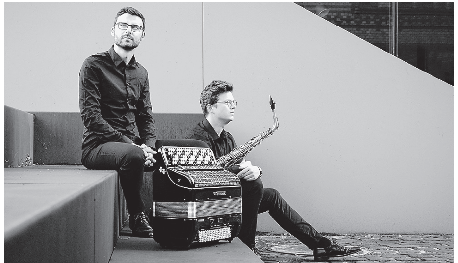
Das Duo Anemos tritt beim zweiten Konzert der Saison am Sonntag, 26. November, um 19.30 Uhr im Ratssaal auf.