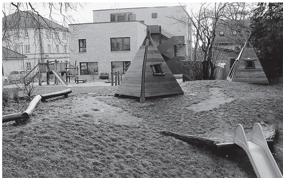
Der Neubau der Parkstraße war der Jury einen Preis wert.

Die Ausstellung Baukultur Hohenlohe-Tauberfranken ist im Arkadenforum bereits geöffnet und kann jetzt ein paar Tage länger, bis einschließlich Freitag, 24. November, jeweils von 8.00 bis 18.00 Uhr besucht werden.