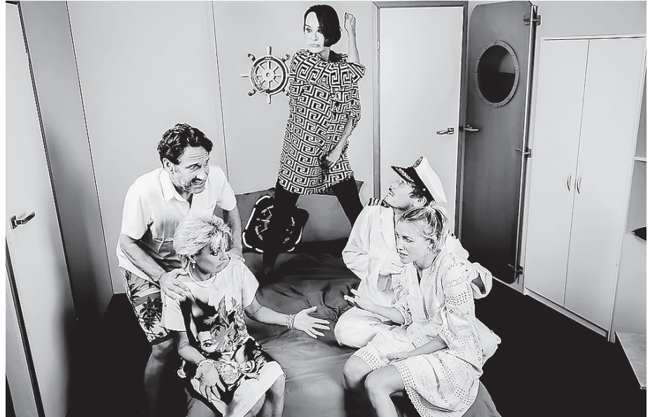
Die Theatergastspiele Fürth präsentieren am 18. November die Boulevardkomödie „Schiff ahoi!“ im Hangar.

Dennis und Katja Becker sind frisch getrennt – das muss natürlich gefeiert werden. Katja lädt ihre beste Freundin Traute ein, mit ihr eine Kreuzfahrt durch das Mittelmeer zu machen, um die neue Freiheit einzuleiten. Leider kommt ihr Ex-Mann Dennis mit seinem besten Freund Tobias auf dieselbe Idee. Es hätte so ein schöner Urlaub werden können – aber plötzlich begegnen sich täglich diejenigen, die sich möglichst so schnell nicht wiedersehen wollten. Was übrigens auch für Traute und Tobias gilt – die waren nämlich früher mal verheiratet. Im Laufe der Kreuzfahrt wird so mancher komödiantische Kampf ausgefochten, den alle gern vermieden hätten. Oder ist gerade dieses ungeplante Aufeinandertreffen ein Start in eine neue Zukunft? Können sich Menschen doch noch mal ändern? Info: Karten sind im städtischen Bürgerbüro für 22 bzw. 26 Euro erhältlich. Weitere Informationen unter Telefon 09751 403-0.