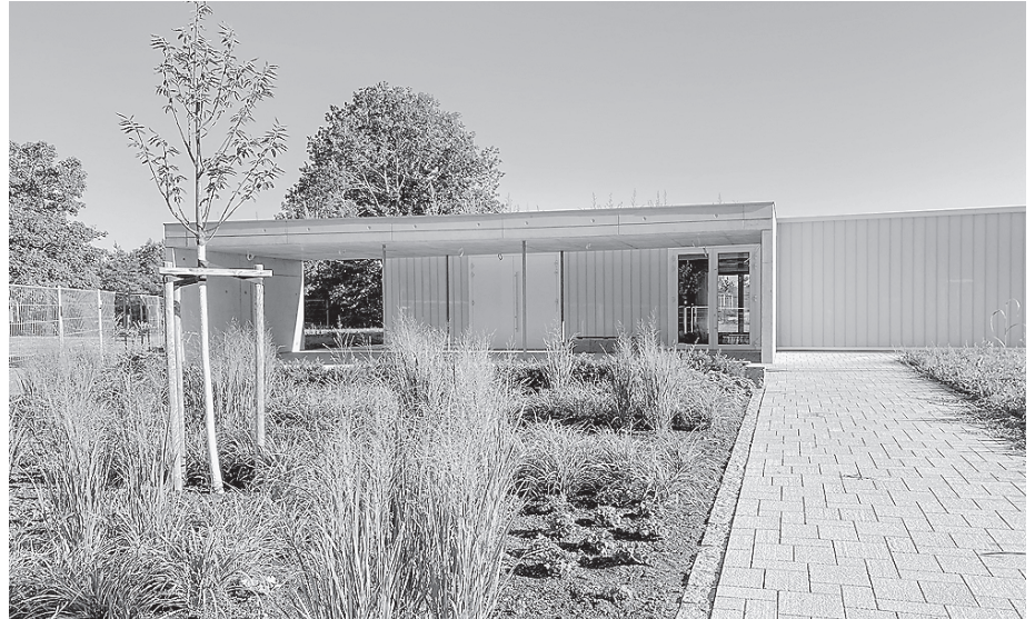
Die Anlage außen ist bereits fertiggestellt und umrahmt das schlichte Gebäude harmonisch.

Beim Fassadenbau gab es eine Verzögerung von etwa einem dreiviertel Jahr, da der Firma gekündigt werden musste. Jetzt ist diese Arbeit beendet, es gibt einen kleinen überdachten und wettergeschützten Bereich. Die Fassade der Leichenhalle auf dem Crailsheimer Hauptfriedhof präsentiert sich modern-schlicht, der vorgesehenen Nutzung sicher angemessen. Auch auf dem Parkplatz hat sich einiges getan.