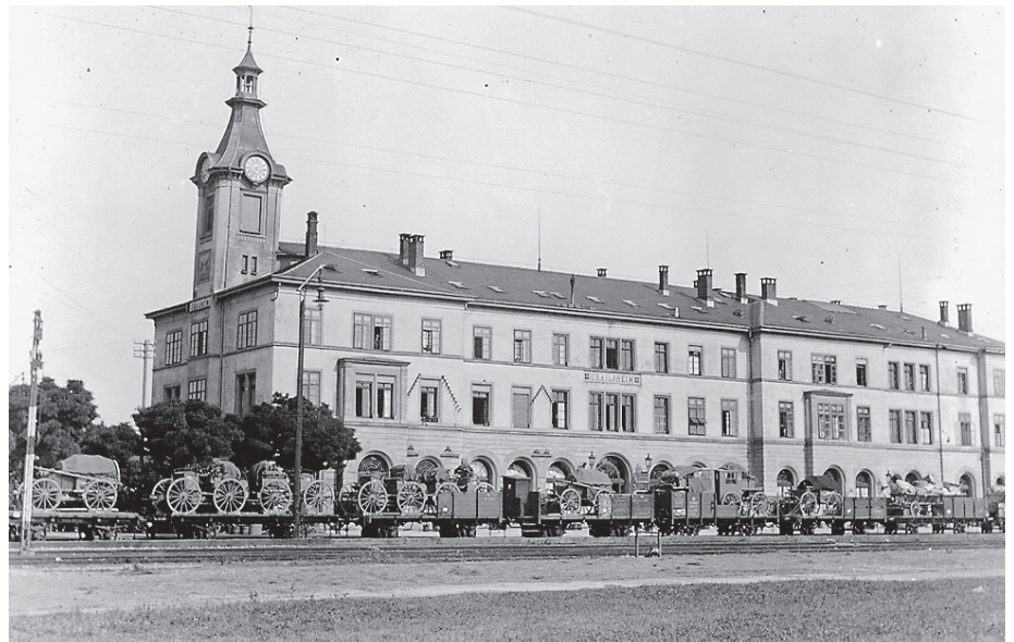
Auch das gehört zur Bahnhofsgeschichte: Ein Militärzug zu Zeiten des Ersten Weltkrieges vor dem alten Bahnhofsgebäude.

Die Geschichte der Crailsheimer Eisenbahn ist abwechslungsreich und zeigt auf, wie sehr die Stadt an der Jagst durch die Bahn prosperierte. So zählte die Stadt 1866 bei der Eröffnung der ersten Bahnstrecke ungefähr 3.000 Einwohner. Zehn Jahre später waren es bereits 4.600 Einwohner. Der Ausbau des Kreuzungsbahnhofes Crailsheim ließ nicht nur eine Vielzahl von Funktionsgebäuden und Gleisanlagen entstehen, sondern auch neue Wohngebiete. Zu Beginn des 20. Jahrhunderts war ein Drittel der Bevölkerung direkt mit der Bahn verbunden, Crailsheim eine ausgesprochene Eisenbahnerstadt. Noch 1964 hatte die Bahn in Crailsheim rund 700 Mitarbeiter und war der größte Arbeitgeber der Stadt. Seit Mitte der 1980er begann dann der Rückbau der Anlagen.