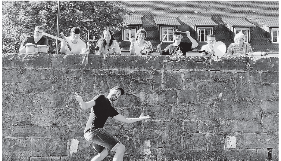
Auch das Percussion-Ensemble „Lärmschutz“ ist bei der Band Night mit dabei.

Info: Die Band Night findet am Freitag, 24. November, von 19.30 bis 21.30 Uhr im Ratskeller statt. Der Eintritt ist frei, die Bewirtung übernimmt das Team des Ratskellers.