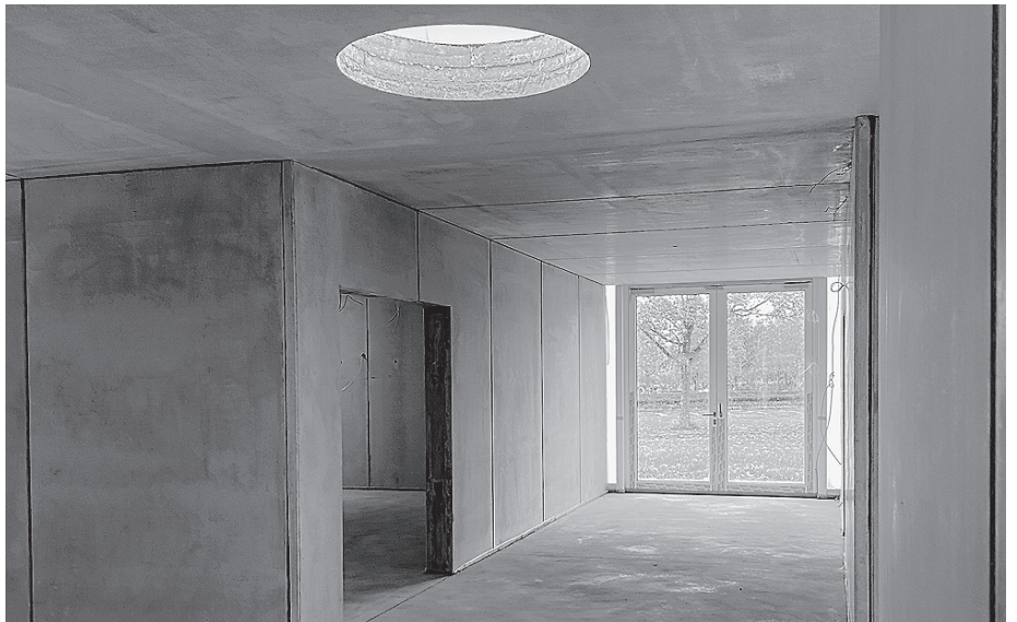
Im hellen Innenbereich wird jetzt ausgebaut.