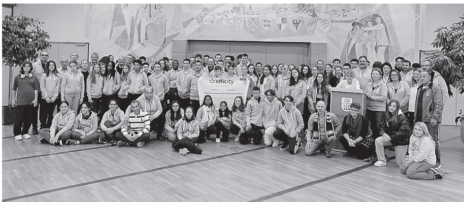
Eine französische Sportdelegation war zu Besuch in Crailsheim.