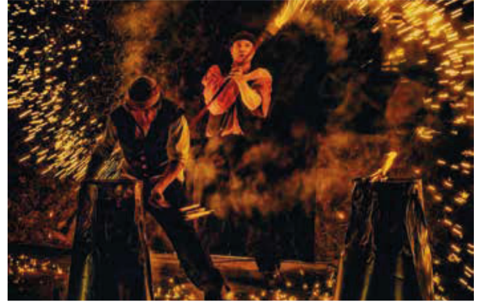
Forzarelllo – Feuershow Fire & Drum