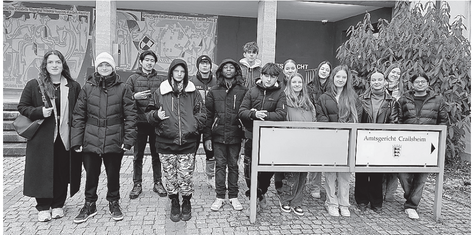
Die Klasse 8a der Leonhard-Sachs-Schule besuchte kürzlich das Amtsgericht Crailsheim und konnte sogar zwei Gerichtsverhandlungen miterleben.