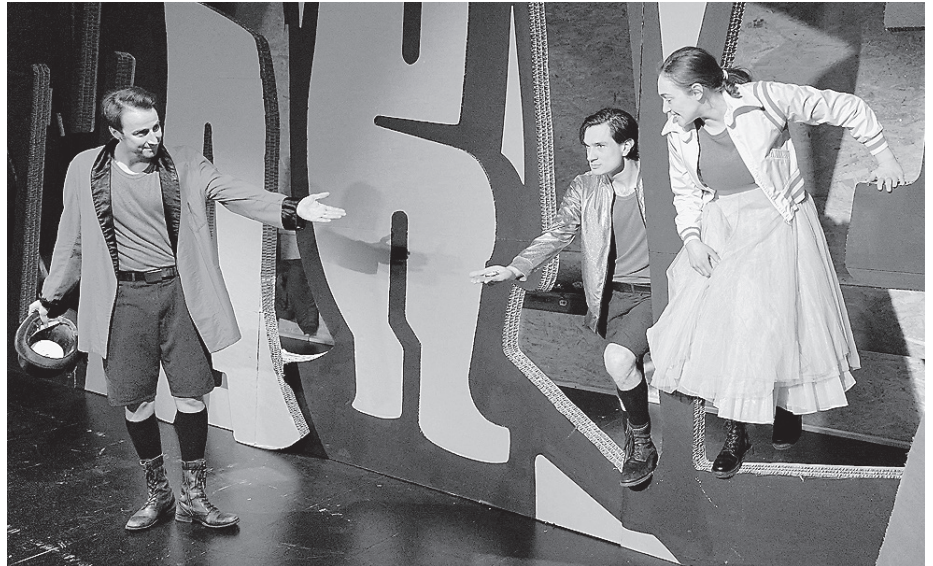
Das Theater Lindenhof ist am Dienstag, 28. Januar, um 18.00 Uhr mit dem Stück „Woyzeck“ im Hangar Event Airport zu Gast.

Woyzeck, das Dramenfragment aus dem Nachlass des bereits mit 23 Jahren verstorbenen Georg Büchner, dreht sich um einen Menschen, der von der Gesell-