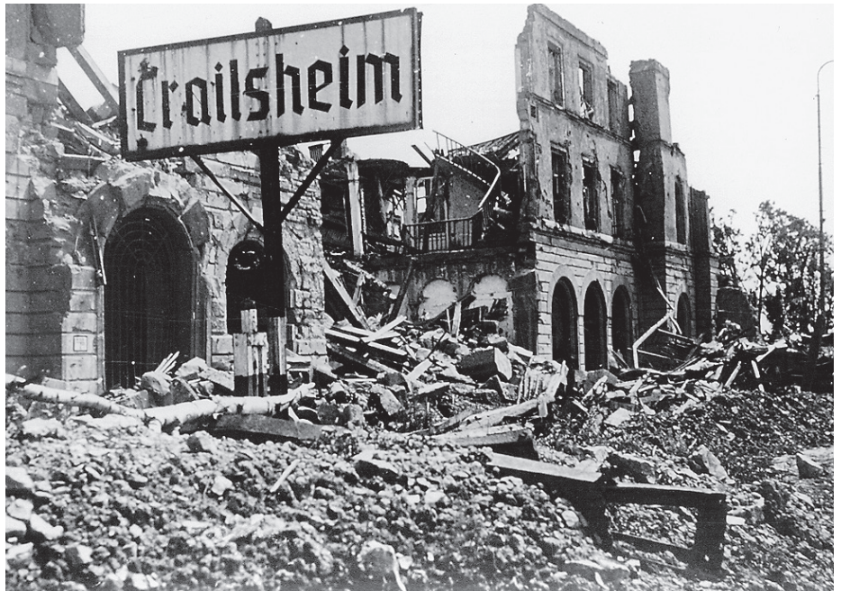
Auch der Crailsheimer Bahnhof wurde nahezu komplett zerstört.

Die „Sonderrolle“ Crailsheims begann am 5./6. April 1945, als motorisierte Einheiten der US-Armee die starken deutschen Verteidigungsstellungen an Neckar und Jagst bei Heilbronn umgingen und in schnellem Tempo entlang der